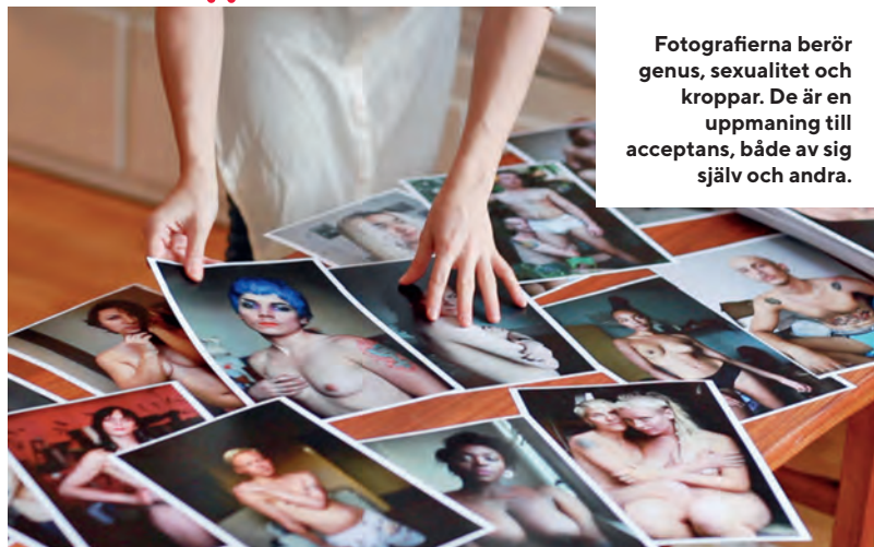
Fotografierna berör genus, sexualitet och kroppar. De är en uppmaning till acceptans, både av sig själv och andra.

– Det är fantastiskt att få vara en del av utvecklingen till ökad självacceptans hos någon, oavsett om det sker genom fotograferandet eller sexualupplysningen. ✿