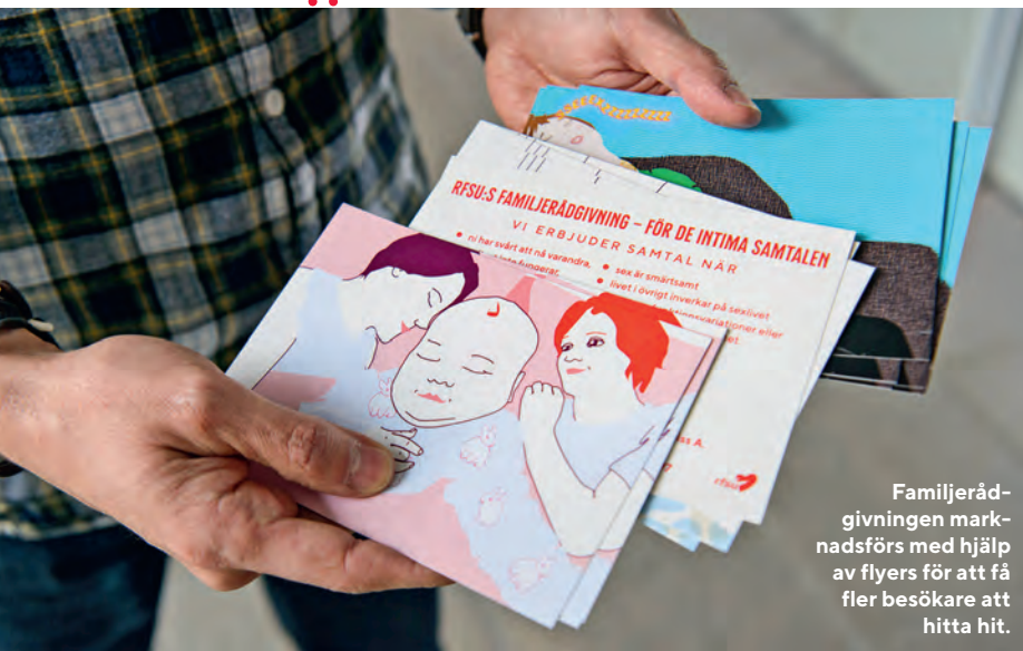
Familjerådgivningen marknadsförs med hjälp av flyers för att få fler besökare att hitta hit.