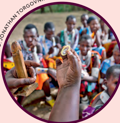
Sexualupplysning av frivilligorganisation i Kenya.