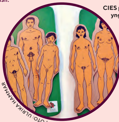
CIES pussel för yngre elever.

*Allsidig sexualundervisning innehåller både biologiska och samhälleliga perspektiv på sexualitet.