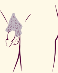
آلت جنسی مرد