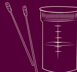
آزمایش ادرار و پنبه گوش پاک‌کن

اگر شما سکس محافظت نشده با افراد دیگر داشته باشید، ممکن است که مبتلا به امراض مقاربتی شوید. بسیاری از امراض مقاربتی، نه بر روی بدن دیده میشوند و نه بر روی بدن احساس میشوند. برای اینکه بدانید آیا به اچ.ای.وی و یا کدام امراض مقاربتی شده‌اید، نیاز است تا آزمایش شوید. اگر شما مبتلا به امراض مقاربتی هستید، میتواند دوا و درمان مجانی به دست آورید.