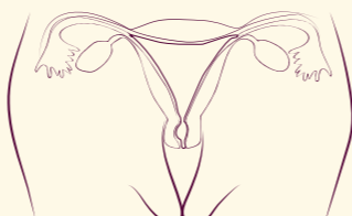
رحم و واژن